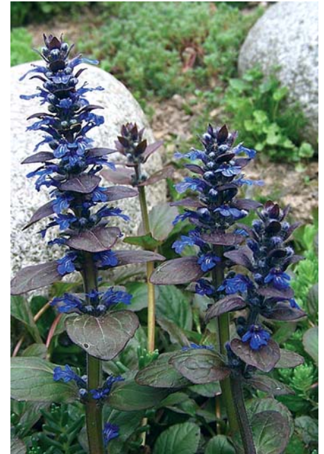
Ajuga reptans sieht nicht nur schön aus, sondern ist sogar essbar.