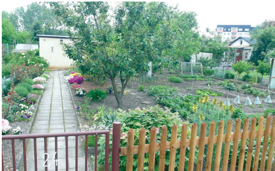
Mindestens ein Drittel der Parzellenfläche sollte zum Anbau von Gartenbauerzeugnissen für den Eigenbedarf genutzt werden.

1994 wurde das BKleingG u.a. im Bereich des Pachtpreises etwas reguliert (Die Pacht darf höchstens den vierfachen Betrag des ortsüblichen