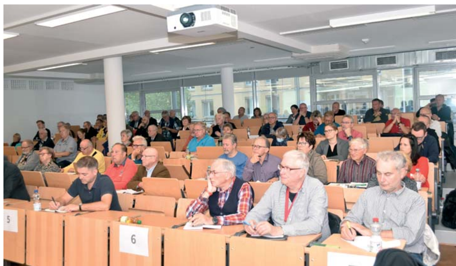
Wissensvermittlung als Dienstleistung: Vereinsvorsitzende bei einem Tagesseminar „Recht im Kleingartenwesen“.

In der nächsten Ausgabe geht es um Kleingarten- und vereinsfachliche Angelegenheiten, die Aufrechterhaltung von Ordnung und Sicherheit sowie die Mitwirkung der Verbände in Arbeitsgruppen und Kommissionen. -r