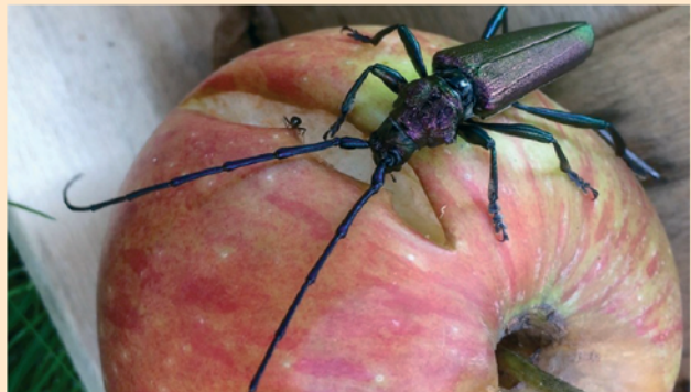
Viele Tierchen finden Äpfel richtig lecker. Auch der Bockkäfer.

In einem Glas Apfelsaft stecken ungefähr ???? gepresste Äpfel.