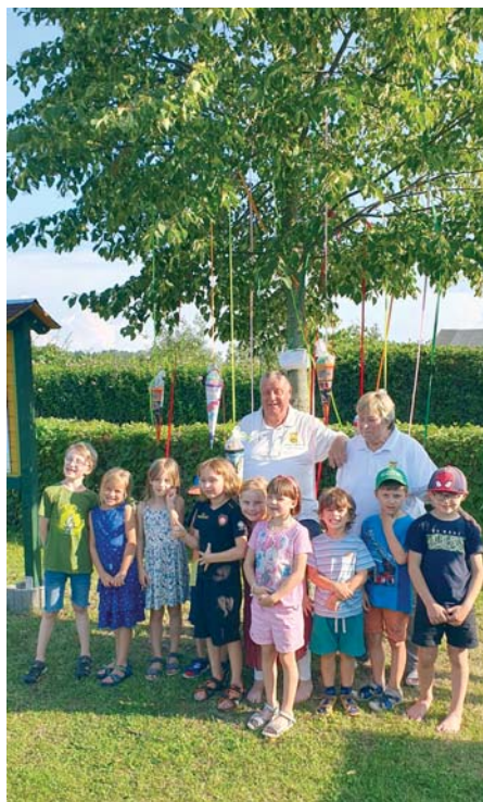
Alles Gute zum Schulanfang!