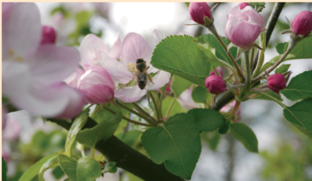
Aus den Blüten am Apfelbaum wachsen später die Äpfel.

Der Apfel wächst an einem Obstbaum. Er hat in seinem Inneren kleine Kerne. Äpfel können eine rote, gelbe oder grüne Schale haben und haben viele Vitamine. Ab Ende August bis in den Dezember hinein werden die Früchte geerntet.