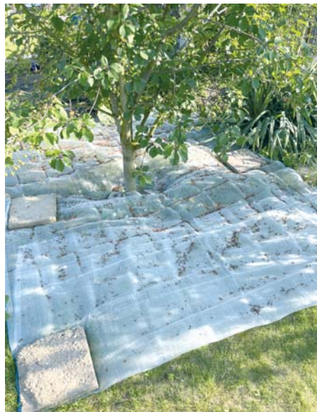
Nicht schön, aber wirkungsvoll: Das Netz stoppt den Purpurnen Fruchtstecher.

Dem wollte ich in diesem Jahr etwas entgegensetzen. Nur was? Warten, bis die noch grünen Kirschen am Baum hängen und dann den Käfer womöglich mehrfach die Woche mit der chemischen Keule bekämpfen? Das kam für mich nicht in Frage. So entschied ich mich für eine vielleicht