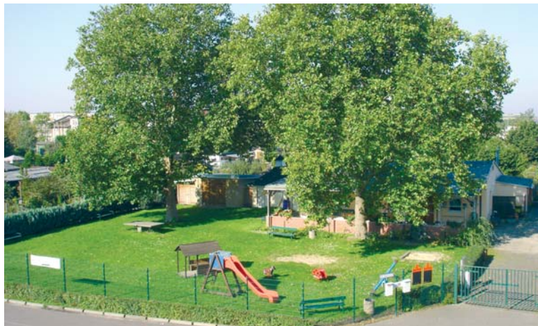
Das Vereinshaus mit dem Spielplatz, aufgenommen 2011.

Der 1914 ausgebrochene Erste Weltkrieg ließ das Vereinsleben stagnieren. Die Tradition des „Schrebergrußes“ wurde weitergeführt. Die Kleingärtner bewirteten bedürftige alte Leute mit Kaffee und Kuchen und beschenkten sie mit Gartenfrüchten.