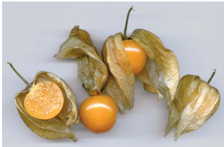
Die Früchte der Physalis dienten Seefahrern dank ihres Gehalts an Vitamin C als Mittel gegen Skorbut.

Die Blüten sind gelb mit schwarzen Flecken. Aus ihnen bilden sich nach acht bis neun Wochen zunächst grüne Laternen, die zur Erntezeit orange bis hellbraun werden. In den Lampions befinden sich nach weiteren sieben bis zehn Wochen die Früchte der Andenbeere. Diese sind essbar, erreichen eine Größe einer Cocktailltomate, schmecken süß-säuerlich und haben einen sehr hohen Gehalt an Vitamin C. Deshalb wurden sie früher vor allem von Seefahrern zum Schutz vor