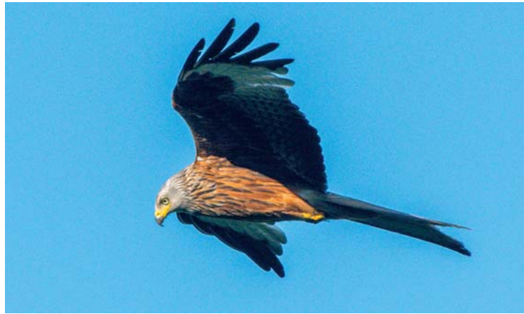
Ein Roter Milan hält nach Beute Ausschau.

aber auch einer der stillen. Wenn er ruft, ist dies eher ein melodisches, fast gesangsartiges Pfeifen oder ein dem Ruf des Bussards ähnelndes Miauen.