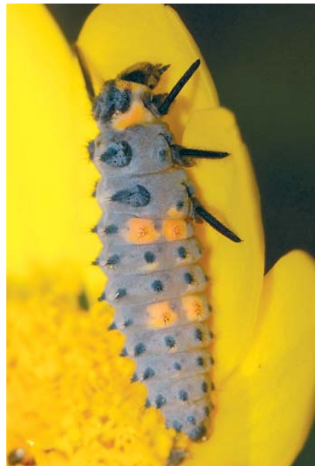
Marienkäfer und ihre Larven (hier die des Siebenpunkts) sind Blattlausvernichter.

Auch wenn Maßlosigkeit nicht unbedingt eine Tugend ist; dafür, dass der Marienkäfer sie beim Fressen an den Tag legt, sollte man ihm Respekt zollen. Zwischen 50 und 100 Blattläuse, Schildläuse, Spinnmilben, Wanzen und ähnliches Getier, das der Pflanzenfreund nicht im Garten haben möchte, verspeist dieser Käfer täglich. Das sind bis zu vier Stück pro Stunde. Für den Gärtner ist der Marienkäfer tatsächlich ein echter Glückskäfer. Seine skurril aussehenden Larven sind noch „maßloser“.